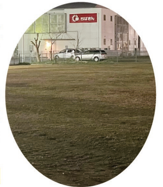
これが50年使われなかった皆様の大切な公共資産です。

今月9日10日には連合町会が主体となり、新たなお祭りに合わせ、 地域を盛り上げるための屋台横丁を開催します 。どうか、この屋台横丁で、これからの辰巳台を皆でデザインし、語り合おうではありませんか。