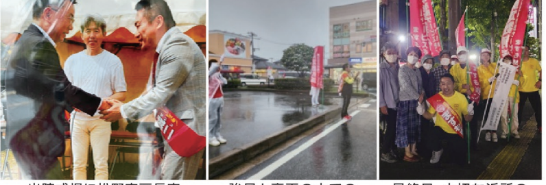
出陣式場に松野官房長官からの緊急激励! 強風と豪雨の中での八幡宿駅街頭演説! 最終日、大切な近所の方々から応援に駆けつけてくれました。泣