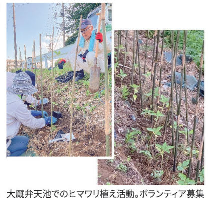
大原弁天池でのヒマワリ植え活動。ボランティア募集