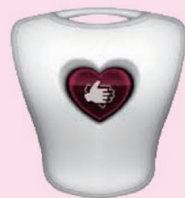
GPS搭載の2000円以下の危機管理グッズを開発します。