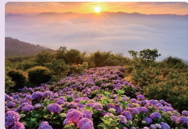
数年先のアジサイ弁天池を目指して

私はある日、「キレイな花壇にはゴミは投げ入れる事ができない」という人間の心理が記した文献を見つけました。そこで、この弁天池を色とりどりのアジサイで