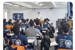
定例議会が終了し、救急救命士教育に専念