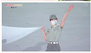
東京五輪開会式で救急隊員が!