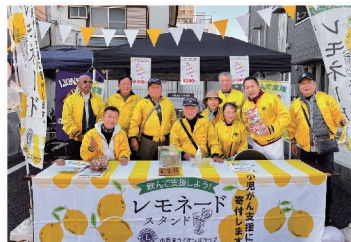
小児がん支援のための活動をしています!