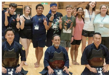
姉妹都市米モビール市の子供たちに剣道を指導しました。