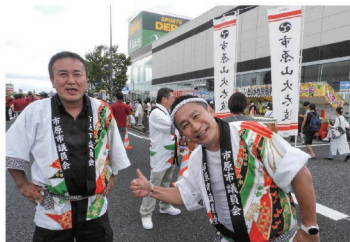
長いコロナから明けて、いちばら国府祭りは大いに盛り上がりました。