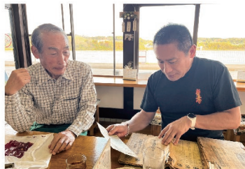
月刊ひまつぶしの作成は、学術論文だけでなく、地域古伝など幅広く取材しています。