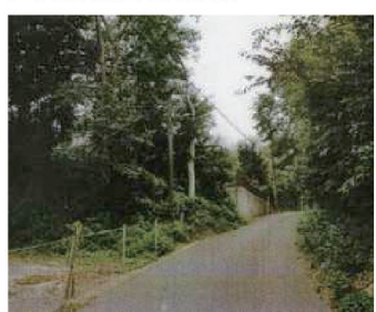
坂を上った先に光善寺がある