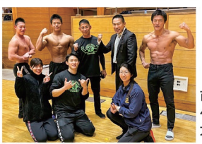
市原ベンチプレス大会にて