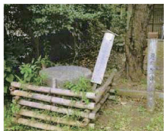
城址後の標識と井戸跡の看板