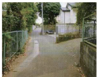
空堀後の道路。鏝が掘り出された