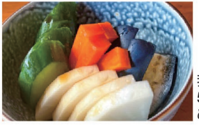
我が家の50年ものぬか漬け