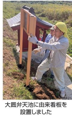
大蔵弁天池に由来看板を設置しました