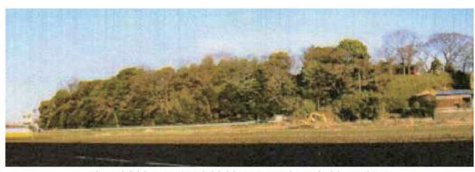
市原城址と阿須波神社のある市原台地の遠景